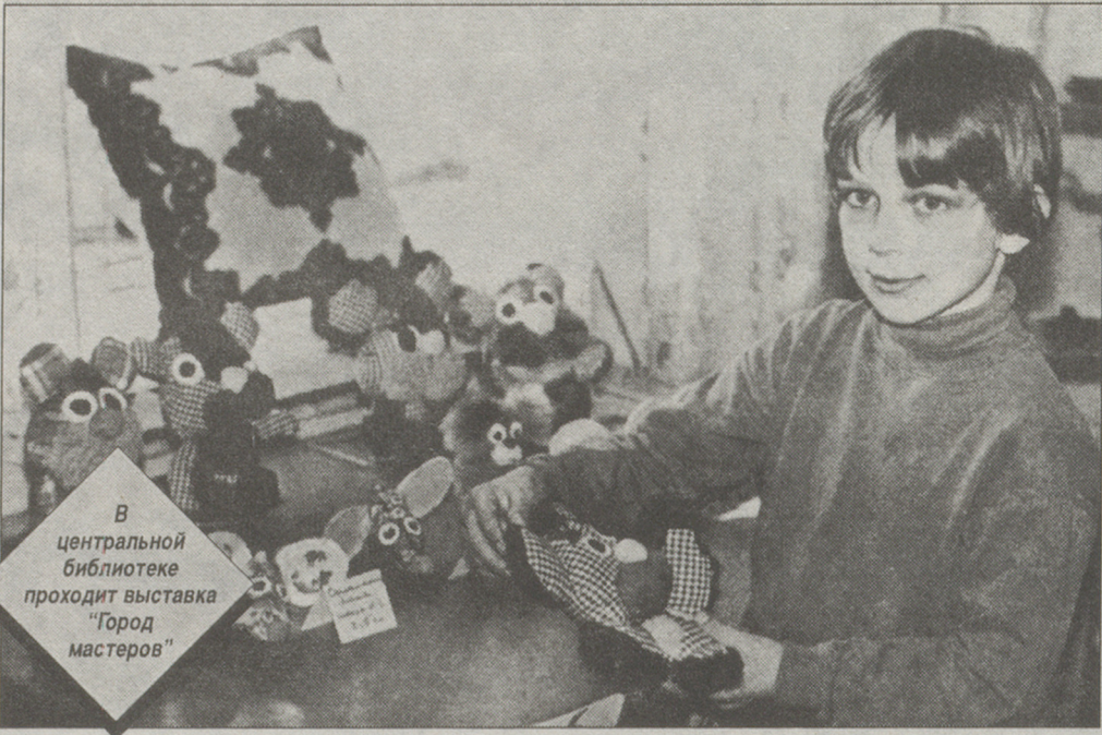
В центральной библиотеке проходит выставка "Город мастеров"